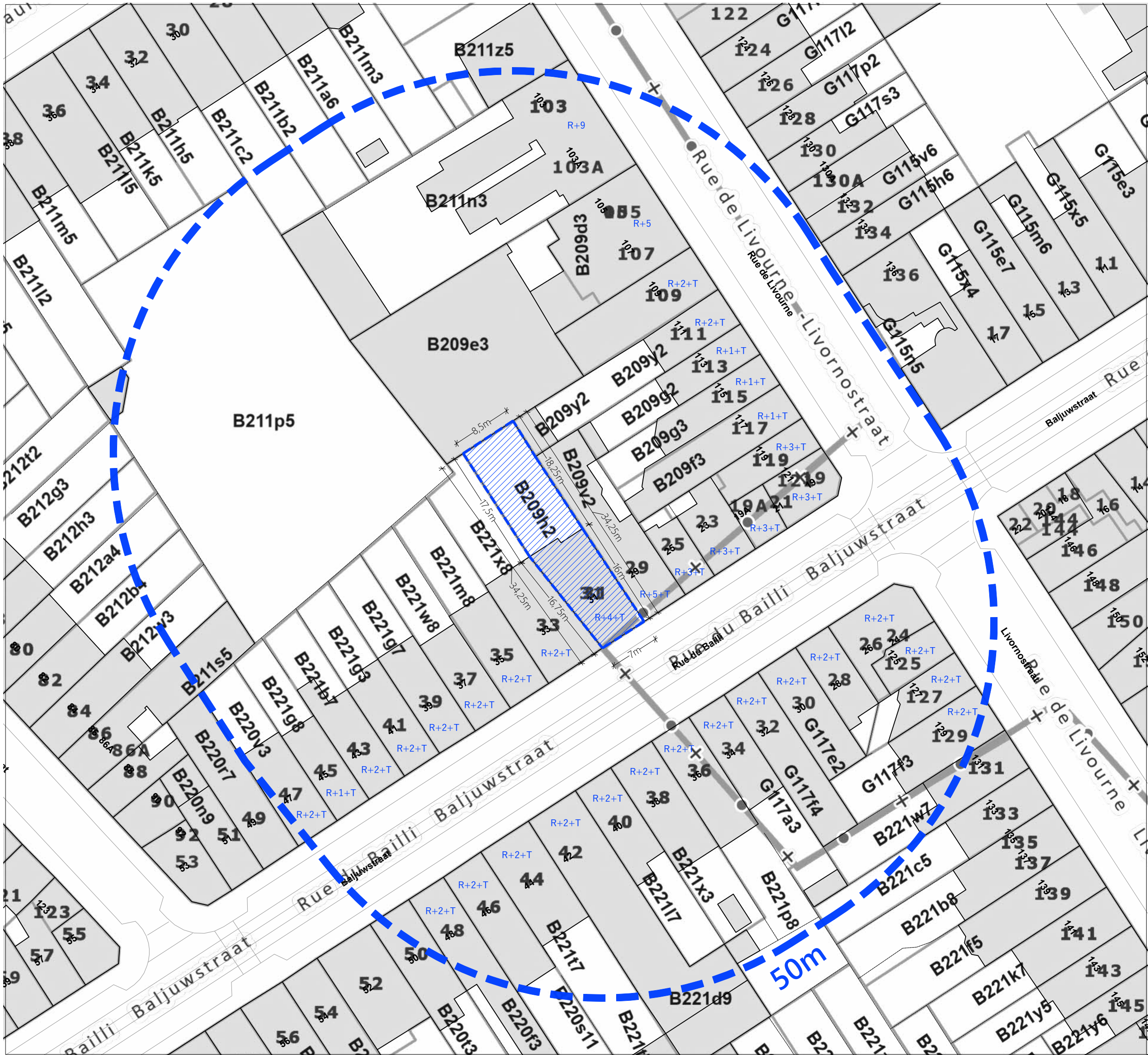
PLAN D'IMPLANTATION ech : 1/500ème PLAN CADASTRAL

PARCELLE 31 : IXELLES 7e DIV, SECTION B n°209 / h / 2 BRUXELLES 7e DIV, SECTION G n°117 / t / 2